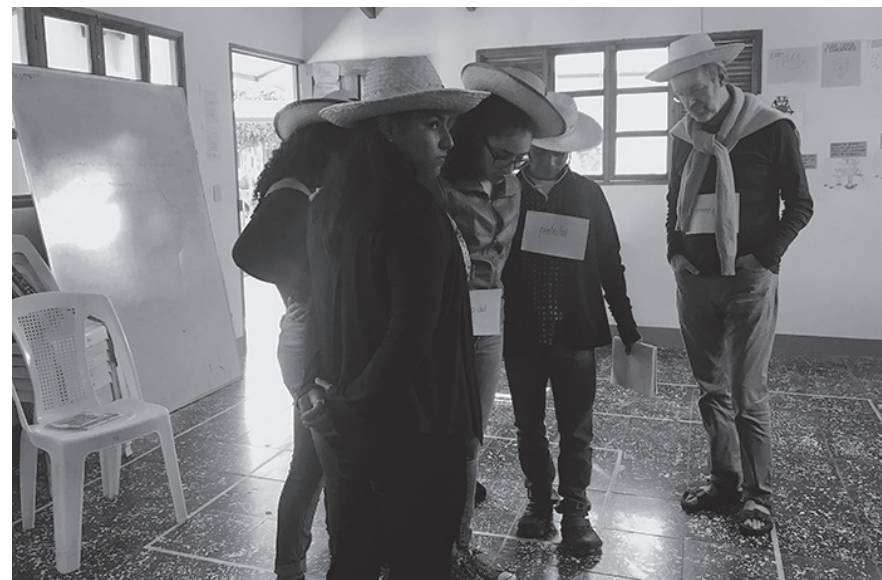
El sistema de roles internos