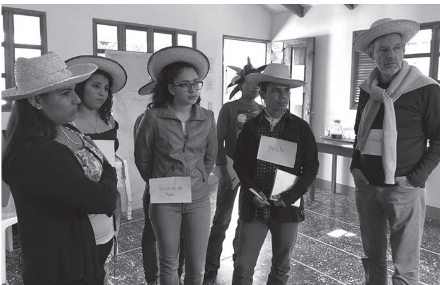
Cada representante se pone en sus zapatos