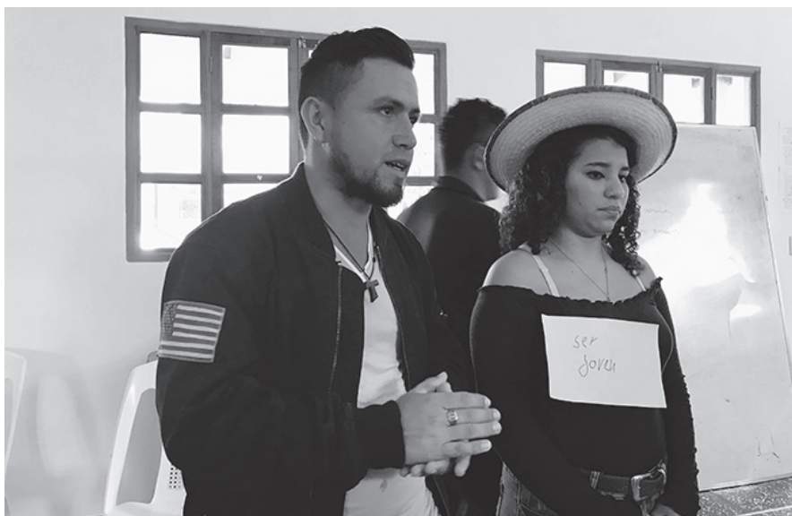
El aportador del caso entra al sistema y explora roles claves.